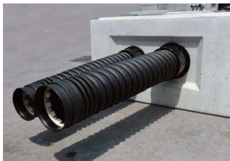
ハンドホール接続例