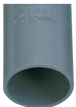
グレー (1.9PB 5.0/0.5)