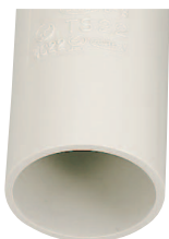
ホワイト (7.3Y 9.4/0.7)