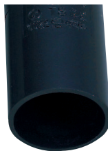
ダークブルー (5.4PB 2.6/0.8)

※上記のマンセル値は当社TSカップリングのもので、 ※商品の色は印刷の関係上、実際と若干異なる場合があります。あらかじめ御了承下さい。