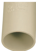
アイボリー (6.7Y 7.8/1.6)